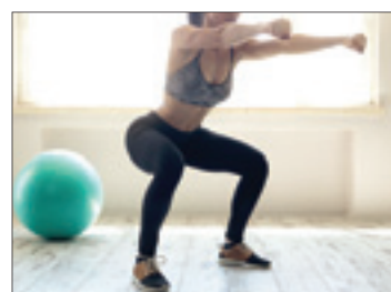
Exercício pode ser feito em casa